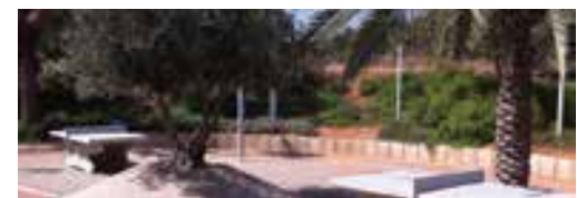
שולחנות הפינג פונג בניגון גן הנופלים