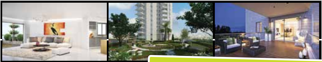
ההדמיות להמחשה בלבד