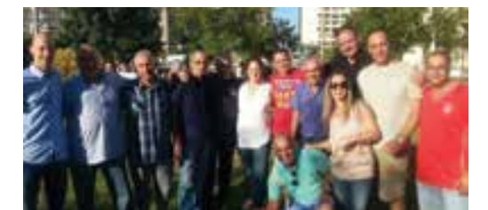
פעילי השכונה עם פרוורם שכונות