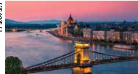
שני עברי הנהר

בודפשט הינה מפגש אמיתי בין מזרח למערב. מבנים אירופאים קלאסיים לצד מרחצאות בסגנון טורקי. שדרות רחבות ידיים ואלגנטיות, והגשרים מעל הדנובה הרומנטית, החוצה בין שני חלקי העיר (בודה-פשט), הופכים אותה לפנינת חן יפהפייה בעלת אופי ייחודי משלה