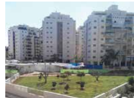
משעול אלכסנדר גרוטו פורח