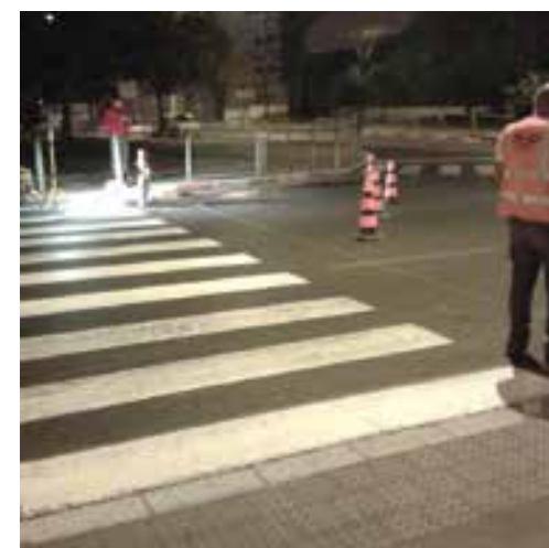
התקנת צנצנים על מעבר החציה בגיסין שבצבע מחדש