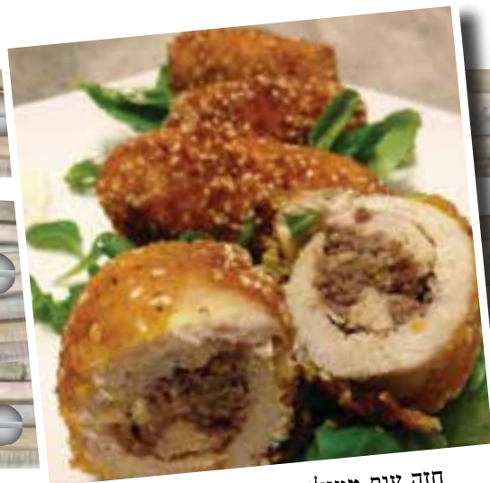
חזה עוף ממולא בשר, צנוברים ושום

במקום לטגן שוב שניצל, שדרגו אותו והכינו ממנו חזה עוף ממולא עם מגוון מליות ורטבים. איך?