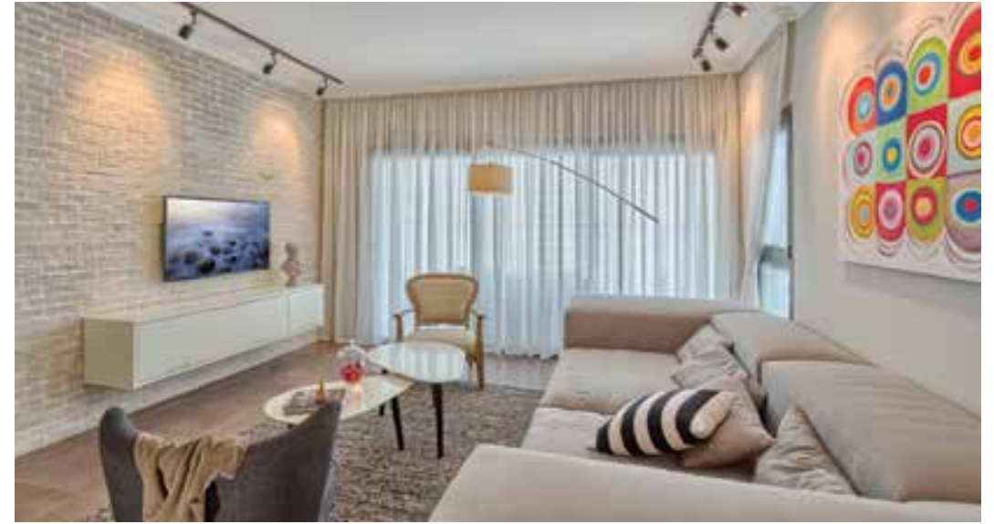
עיצוב פנים: שירן לידור | צילום: דימה פיטרוב